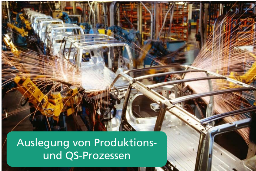
Auslegung von Produktions- und QS-Prozessen